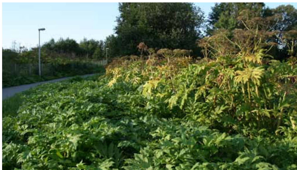
Tromsøpalme. Kjempebjørnekjeks og tromsøpalme er svært like både av utseende og biologi. På Østlandet er kjempebjørnekjeks vanligst, mens tromsøpalmen er vanligere i nord.