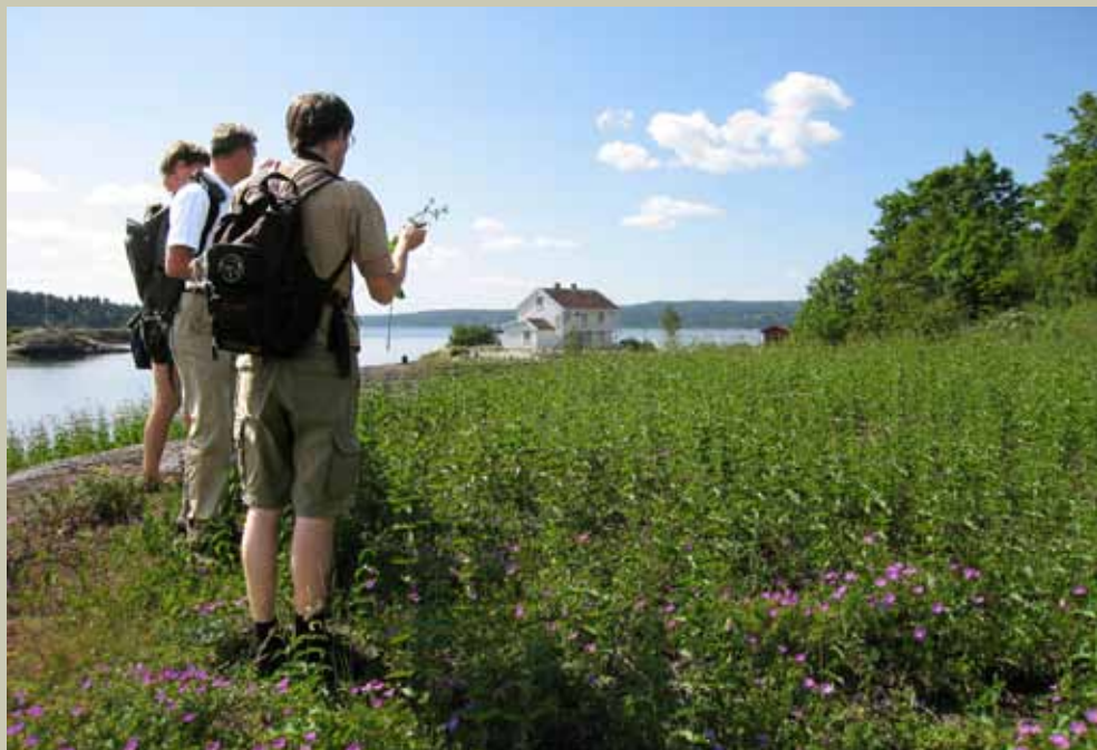
Russesvalerot, Heggholmen.

Gunstig klima og kalk- og skiferrik berggrunn gir grunnlag for en mangfoldig flora på øyene og i kystområdene i indre Oslofjord. Indre Oslofjord har faktisk den mest mangfoldige artssammensetningen og den største forekomsten av rødlistearter i hele Norge. Rødlistearter er arter som er sjeldne eller truet, og vil ofte være indikatorer på sjeldne eller truede naturtyper med store verneverdier. Dette livsmangfoldet blir forsøkt ivarettatt i flere verneområder som er opprettet de siste årene.