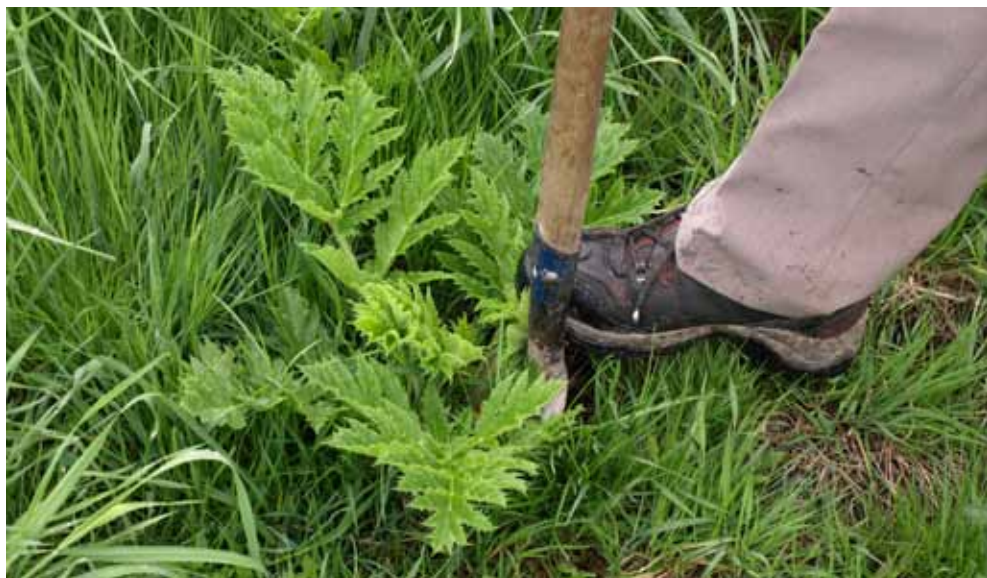
Kjempebjørnekjeks som spås opp.