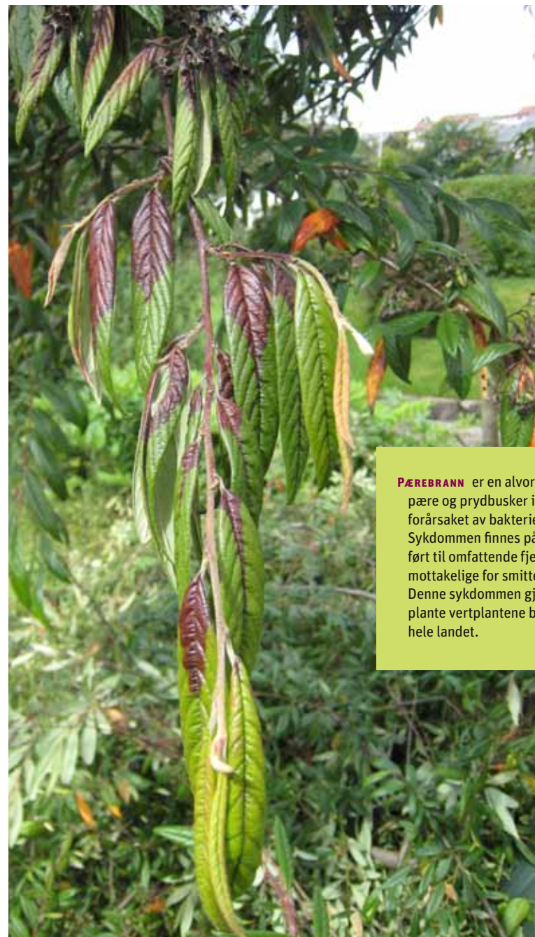
Symptomer på pærebrann på pilemispel.

BLINDPASSASJERER PÅ HAGEPLANTER: Noen kan kanskje fristes til å ta med seg en spennende plante eller stikling hjem fra utlandet for å dyrke i sin egen hage. Det er viktig at alle vet og tar på alvor at alt slikt materiale kan ha med seg uønskede følgeorganismer. I Norge har vi strenge regler for innførsel av planter og plantemateriale. Privatpersoner oppfordres til ikke å ta med planter og plantemateriale hjem fra utenlandsreiser. De som likevel har ønske om å ta med slikt materiale til Norge må sette seg godt inn i importreglene på forhånd. Mer informasjon om importreglene og de ulike artene finnes på www.mattilsynet.no .