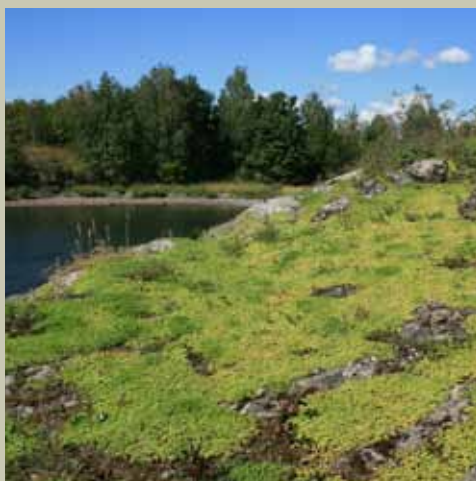
Gravbergknapp på berg på Torvøya, Bærum.