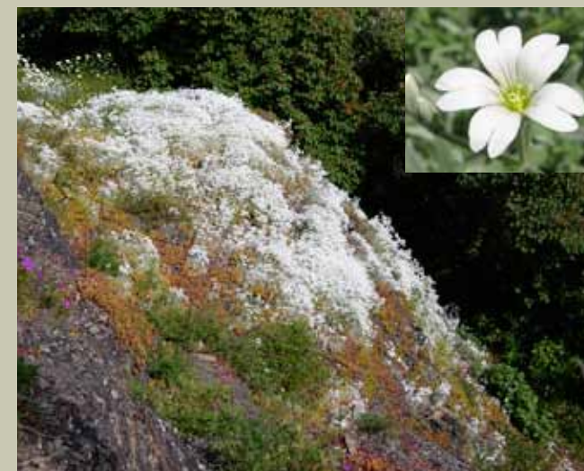
Filtarve, Bleikøya.

BEKJEMPELSE: Luking flere år på rad og/eller tildekking.