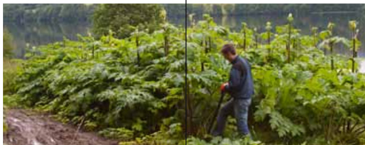
Bekjempelse av kjempebjørnekjeks.