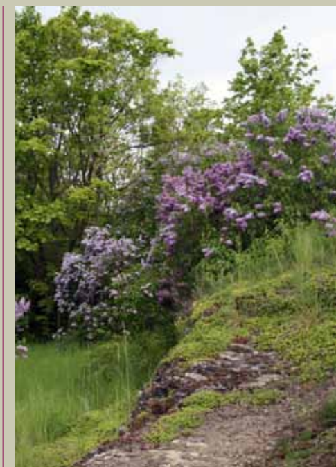
Syrin i spredning på Langøyene i Oslo.