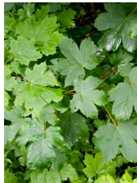
Den naturlig forekommende spisslønn til venstre, til høyre er platanlønn som har butte blader.

komposteres, men legges i tett plastsekk. Oppgraving eller rotkutting fungerer normalt ikke som bekjempelsesmetode, siden planten har et dypt og velutviklet rotsystem som blir påvirket til å danne nye sideskudd når roten deles. Spres lett med flytting av jord.