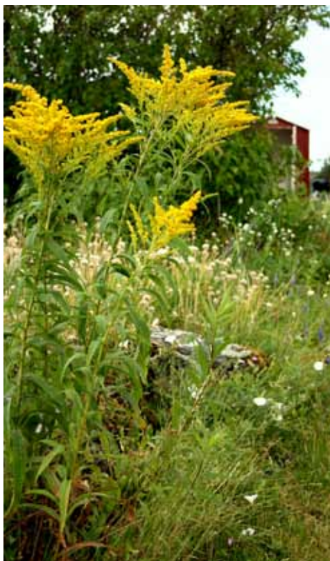
Kanadagullris. Foto: Anne Kjersti Narmo.

ANNET: Kjempegullris Solidago gigantea ssp. serotina er svært lik kanadagullris, men har kraftigere vekst og trives bedre på fuktigere mark. Planten har sannsynligvis de samme invaderende egenskapene som kanadagullris. Kjempegullris har etablert seg enkelte steder på Østlandet.