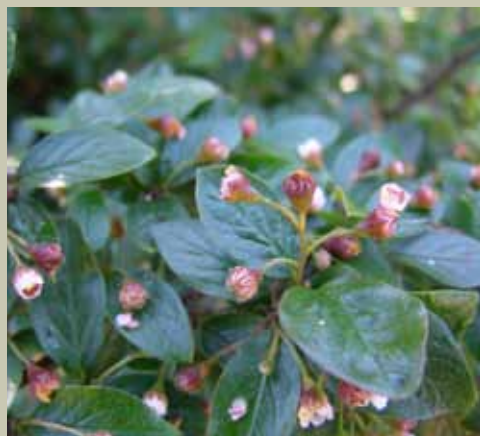
Mispel. Blankmispel er den vanligste mispelarten som er forvillet i Oslofjorden.

ANNET: Fjern ikke mispelarter om du ikke kan skille på artene. To viltvoksende arter finnes på øyene, dvergmispel og svartmispel, den sistnevnte er meget sjelden og med på Norsk Rødliste 2006. Det er forbudt å importere mispler på grunn av faren for smitte av pæreprann og totalt planteforbud for bulkemispel og pilemispel.